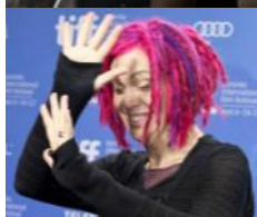
Récemment ajouté au corpus : « Mile End lesbien » Zoé Cousineau témoigne dans La Presse ; Lana Wachowski fait son coming out transgenre au festival international du film de Toronto.